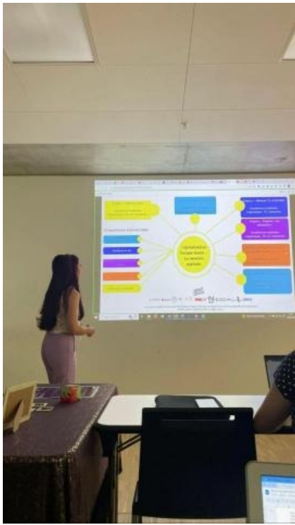
Dolly Ramella lors de la capitalisation dans l'atelier : FLEscape, un environnement immersif pour augmenter les interactions entre acteurs sociaux et développer des compétences en langues étrangères