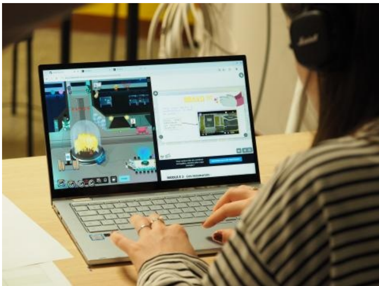
Les étudiants de Rennes 2 ont profité de cette formation pour découvrir le Monde Virtuel RENNES2D.