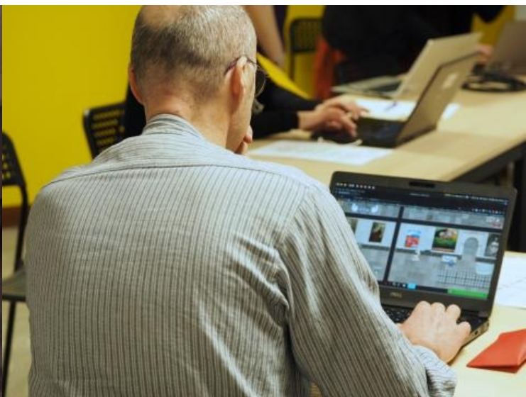
Les participants se sont formés aussi en autonomie