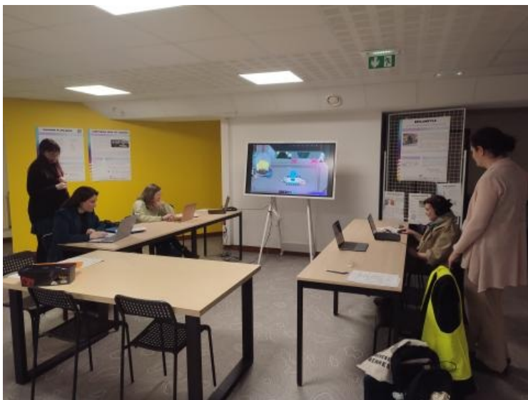
Présentation des Ateliers