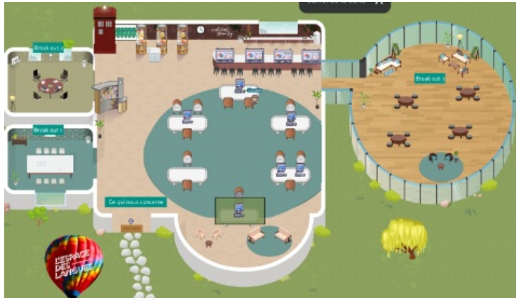
Version finale de la salle d'exposition sonore

Création d'une exposition sonore de récits associatifs collectés pour le corpus de recherche intitulé « Ce qui nous concerne » de William Kelleher. L'exposition sonore va mettre en valeur une version numérique et ludique du corpus de recherche « Ce qui nous concerne ». L'exposition sonore va servir de modèle pour l'espace de recherche LIDILE sur le monde virtuel de l'Espace des langues. Le modèle d'architecture sur le « Menu de recherche » sera utilisé comme modèle pour d'autres projets de recherche de l'Espace des langues. L'exposition souhaite, enfin, mettre en valeur les avantages des mondes virtuels pour l'hébergement et la diffusion des données de recherche. Puisque l'accès au monde virtuel se fait par le biais d'un avatar, il est à la fois ouvert et sécurisé. En effet, il est difficile de télécharger les données hébergées sur l'ordinateur personnel d'un utilisateur.