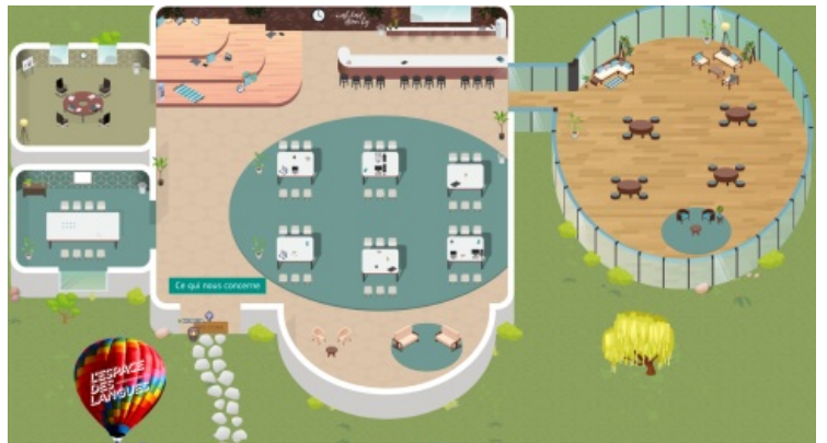
La salle d'exposition sonore